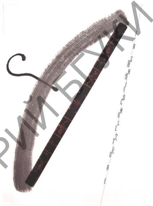
Рис.2. «Фестиваль одежды и культуры» в Нинбо. Афиша, 1999.