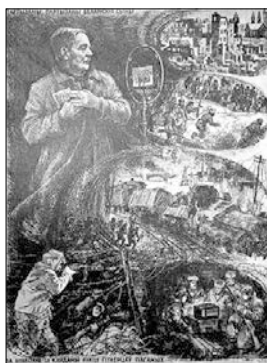
С. П. Герус (1925—1998). Літаграфія «Я. Купала. Партызаны, партызаны...» (1982; 60x80)