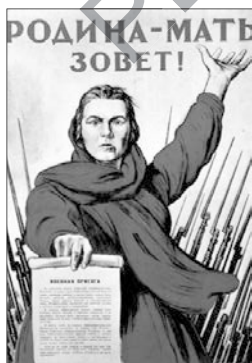
Іраклій Таїдзэ (1902—1985). Плакат «Радзіма-маці кліча» (чэрвень 1941 г.)